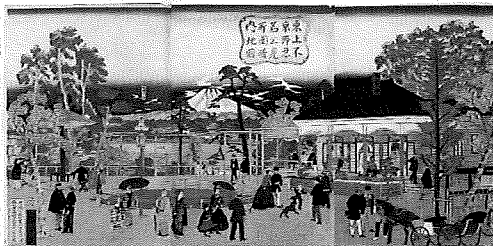
東京名所之内 上野公園地不忍見晴図 歌川広重(三代) 明治9年(1876)