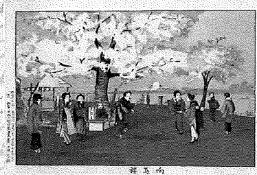
向寫桜 小林清親 明治13年(1880)