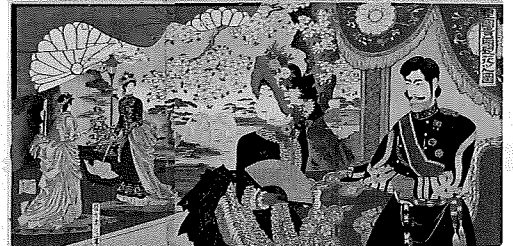
皇国貴顕観花之図 楊洲周延 明治20年(1887)